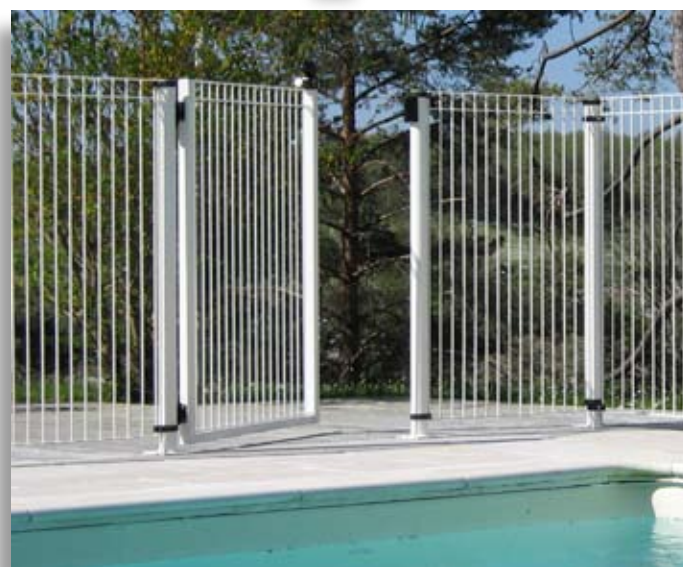
Portillon Décorella® 3